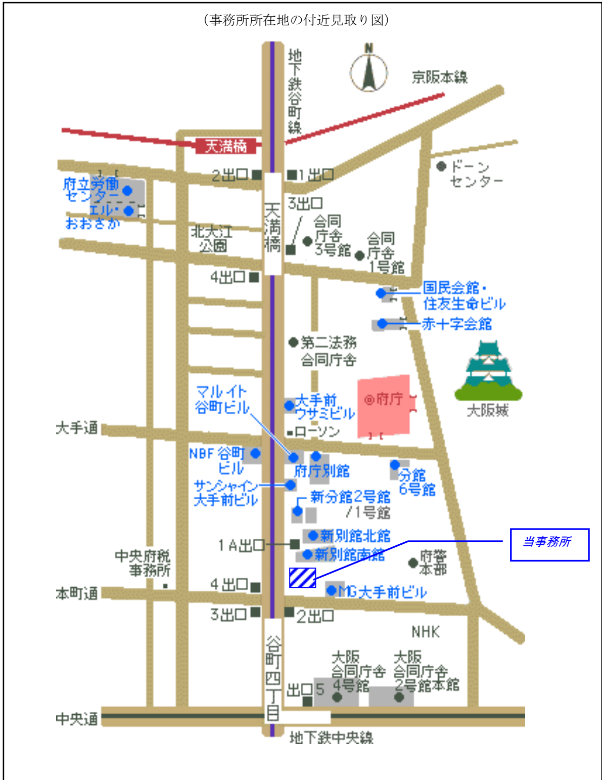
(事務所所在地の付近見取り図)